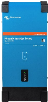
Phoenix Wechselrichter Smart 12/2000